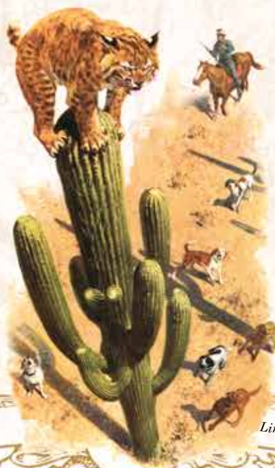
Lince Rojo, especie amenazada.

18.) Tagliatelle Nueva Orleans Estilo sureño con gambas y champiñones. Sólo Fin de Semana 11,90 €