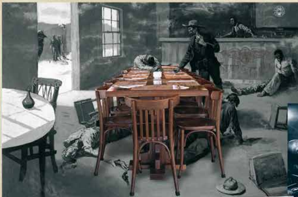
«El Duelo», Oleo sobre lienzo. Aut: Frederic Remington, 1889. Fotomontaje con objetos del restaurante.

Mínimo para cuatro personas. Pregunten a nuestro personal.