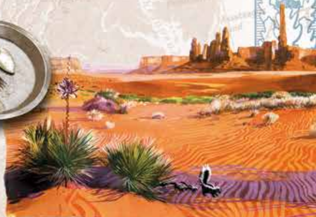
«MONUMENT VALLEY» - Nación Navajo, Arizona

58.) Green Burger Para los vegetarianos. Hamburguesa de verduras. ¡SOLO! 9,20 €